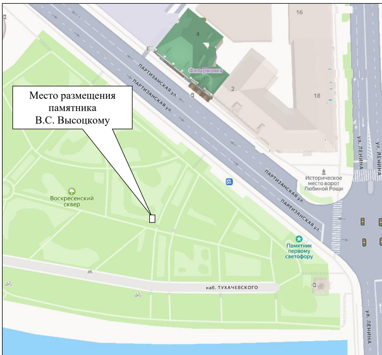
Схема размещения памятника В.С. Высоцкому в Центральном административном округе города Омска